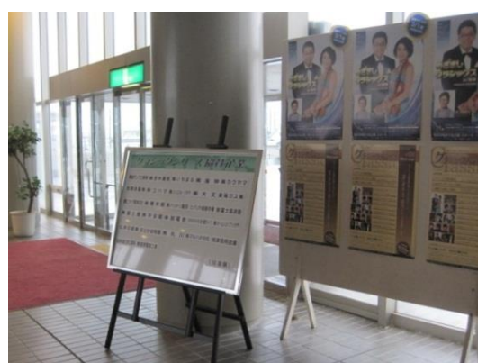
文化会館ロビーでの告知例